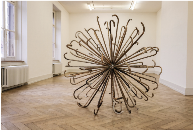
Il sentiero del tempo | Der Weg der Zeit Kunstinstallation aus 93 hölzernen Spazierstöcken

93 hölzerne Spazierstöcke... jeder für sich einzigartig. Spuren zeugen von Gebrauch, Zeichen von Gelebtem, beharrlich dem Wetter und den Gezeiten getrotzt. Nun vereint zu einer dynamischen Form, fragil anmutend, luftigleicht, ja fast beschwingt. Glänzend im Kern, gegen Aussen mit verwitterter Patina. Menschlichkeit wird spürbar und berührt. Geschichten liegen in der Luft und schweifen beim Vorüberziehen den Gedankenfluss der Betrachterin und des Betrachters... il sentiero del tempo – Der Weg der Zeit